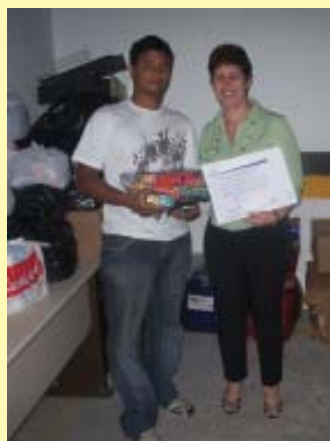
Salete fez a entrega das doações arrecadadas entre os alunos da Cultura Inglesa

No mês de julho recebemos doações importantíssimas. A Cultura Inglesa nos doou 4.653 itens de produtos de higiene, resultado de uma gincana realizada entre alunos de diferentes filiais. A Chemtech coletou entre seus funcionários 558 peças de agasalhos e roupas, 18 cobertores e 5 edredons. Chegaram também da Creche Pequenos Pensadores vários agasalhos. Com essas doações, nossas famílias serão mais bem atendidas em qualidade, recebendo itens que propiciarão melhor qualidade de vida, portanto, mais saúde.