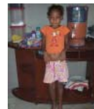
Filtro e kit de higiene

Nessas visitas, muitas vezes são levadas doações diversas para atender as necessidades mais urgentes da família, como colchonetes, filtros e tampos de vaso sanitário. Também são realizadas para acompanhar fretes que levam móveis e utensílios domésticos para as casas.