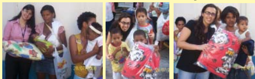
Chemtech entrega os agasalhos às famílias.