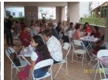
Nosso Chá Beneficente foi bastante concorrido.